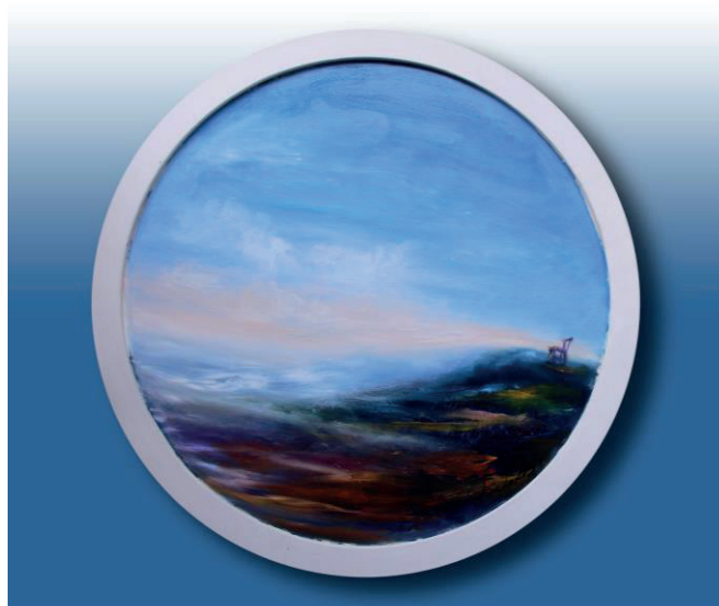
[Dipinto a bocca di Santina Portelli]

Ingresso libero fino ad esaurimento posti